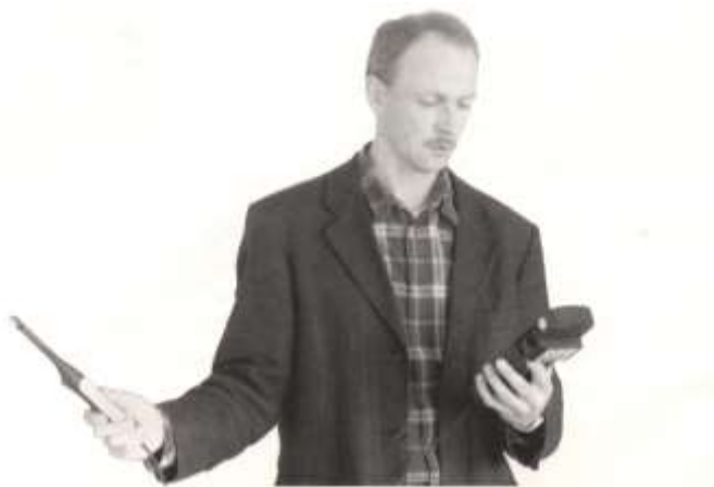
Abbildung 2-3 richtige Handhaltung bei der Messung der Lufttemperatur