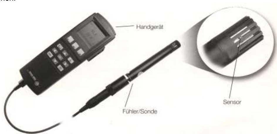
Abbildung 2-1 Bestandteile eines Messgerätes

Die Messung der Lufttemperatur ist eine grundlegende Messaufgabe. Sie kommt zum tragen bei der Kontrolle von Beheizung und Belüftung aber auch bei der Beurteilung von Behaglichkeit und Schimmelschäden. Gemessen wird stets die tatsächliche Temperatur der Luft, unabhängig davon, ob sie stehend oder bewegt ist, obwohl sie unterschiedlich empfunden werden. Ebenso wichtig ist es die Ansprechzeit des Messgerätes zu berücksichtigen genauso wie es vor strahlenden Körpern zu schützen um eine möglichst hohe Messgenauigkeit zu erreichen.