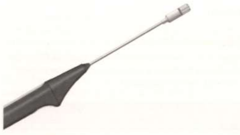
Abbildung 2-5 Federbandfühler

Federbandfühler eignen sich zur Messung auf Untergründen wie Tapeten, Putze, Steine oder Beton. Ist die Oberfläche sehr rau, z. B. Rauputz, kann der Wärmeübergang mit einer Wärmeleitpaste verbessert werden. Die Angleichzeit bei Federbandfühlern ist bei schlechten Wärmeleitern prinzipiell länger und kann bis ca. 10 Sekunden dauern.