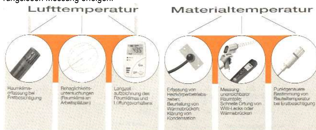
Abbildung 2-4 Übersicht über Messgrößen und Bauform

Die Materialtemperatur kann gemessen werden mit dem Messprinzip der berührenden Messung oder berührungslosen Messung erfolgen.