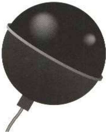
Abbildung 2-2 Globe- Thermometer

Behaglichkeitsmessungen werden mit einem Globe- Thermometer durchgeführt. Diese wird nicht bewegt, sondern mit einem Stativ unbeweglich platziert, und zwar in drei festgelegten Höhen, die in der DIN 1946-2 bzw. in der VDI 2080 beschrieben sind. Das Globe- Thermometer besteht aus einer mattschwarz lackierten, hohlen Kugel.